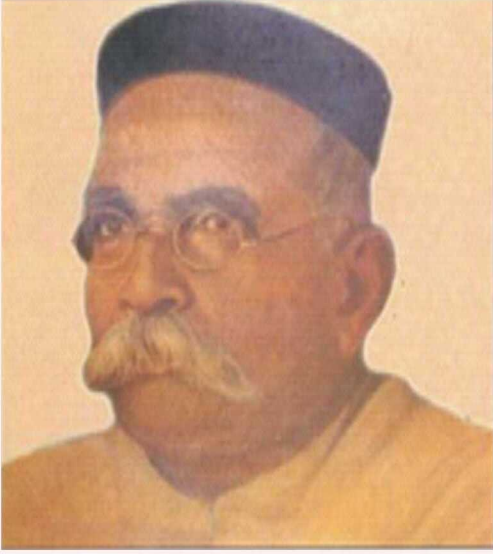
आचार्य महावीर प्रसाद द्विवेदी (1864–1938)

आचार्य महावीर प्रसाद द्विवेदी (1864–1938) को हिंदी के एक महान साहित्यकार, पत्रकार एवं युगप्रवर्तक के रूप में जाना जाता है। उन्होंने हिंदी साहित्य में साहित्यिक एवं सांस्कृतिक चेतना का भाव सृजित कर भाषा की संवृद्धि में अभूतपूर्व योगदान दिया। उनके इस उल्लेखनीय योगदान के कारण ही आधुनिक हिंदी साहित्य के द्वितीय युग (1900–1920) को द्विवेदी युग की संज्ञा दी गई है। आचार्य द्विवेदी हिंदी की कालजयी पत्रिका 'सरस्वती' के सत्रह वर्षों तक संपादक रहे। पत्रिका ने आचार्य जी के संपादन में गुणवत्ता, सामग्री एवं प्रस्तुति आदि ने अपूर्व प्रतिमान स्थापित किए एवं अनेक नए रचनाकारों को खोजकर उन्हें स्थापित करने में उल्लेखनीय भूमिका निभाई जिससे हिंदी के प्रचार-प्रसार का मार्ग प्रशस्त हुआ।